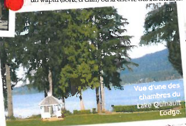
Vue d'une des chambres du Lake Quinault Lodge.

La première halle des USA mettant en contact petits producteurs locaux et consommateurs est née il y a 100 ans d'une flambée du prix de l'oignon. Après une virée parmi les étals de fruits, légumes et crustacés, on assiste à l'incroyable lancer de saumons entre vendeurs de poissons (par-dessus notre tête !) puis on prend un breakfast XXL (pancakes, saucisses, bacon...) chez Lowell's, à l'étage, avec vue sur les bateaux de pêche filant vers l'Alaska.